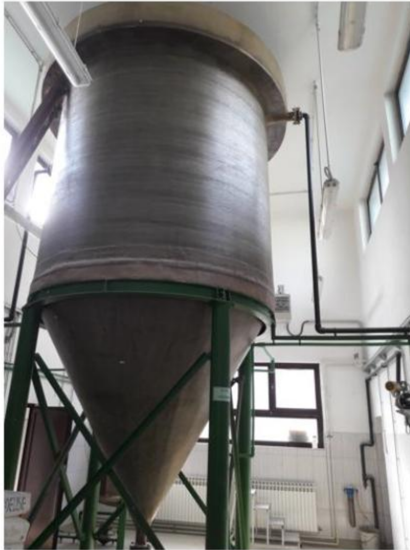
Vertikalni taložnik V=15 \text{ m}^3