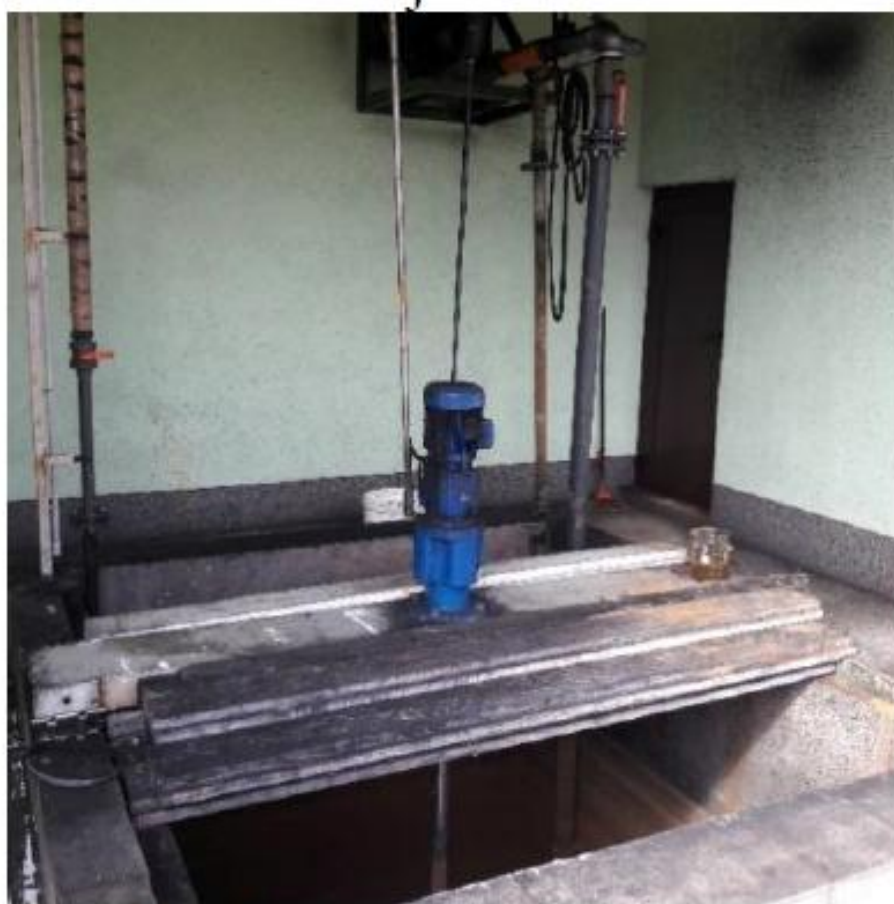
Slika broj 7 Bazen za aeraciju