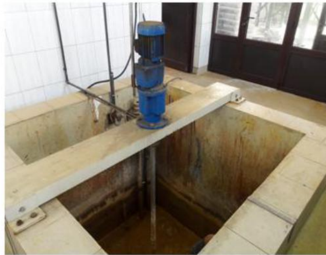
Bazen za neutralizaciju toka I