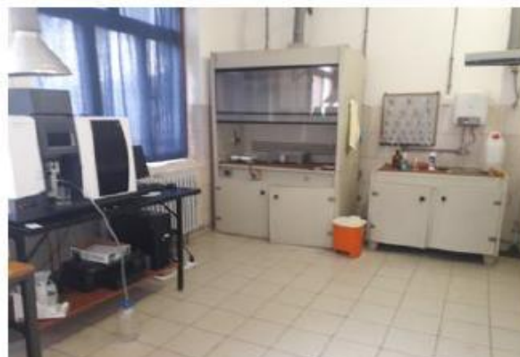
Laboratorija za ispitivanje otpadnih voda UNIS „GINEX“ Slika broj 9