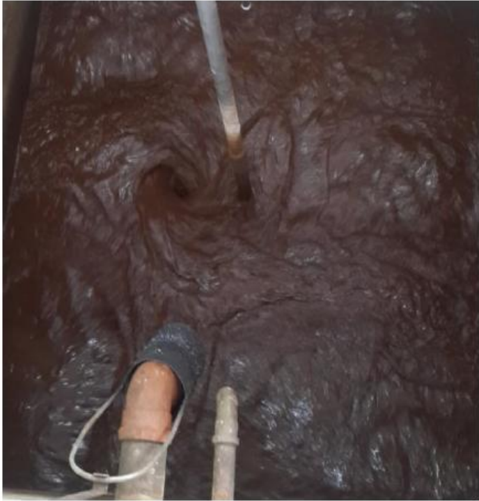
Voda prije tretmana