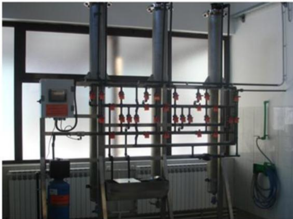
Jonoizmjenjivačke kolone za uklanjanje žive