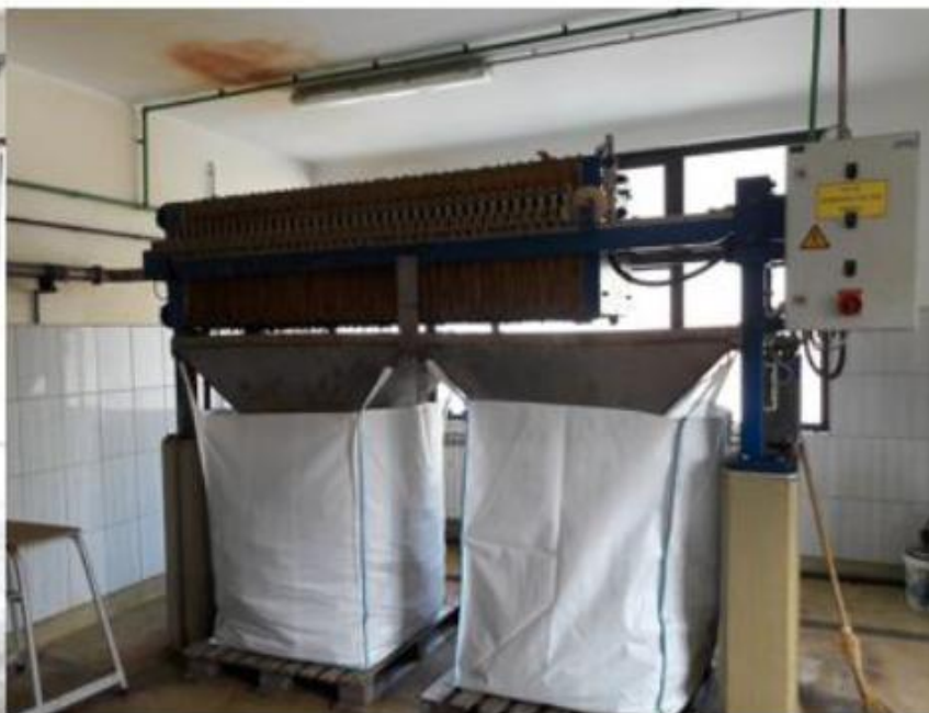
Komorna filter presa