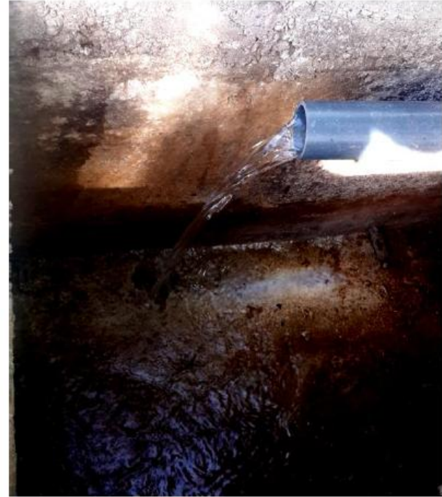
Voda nakon tretmana