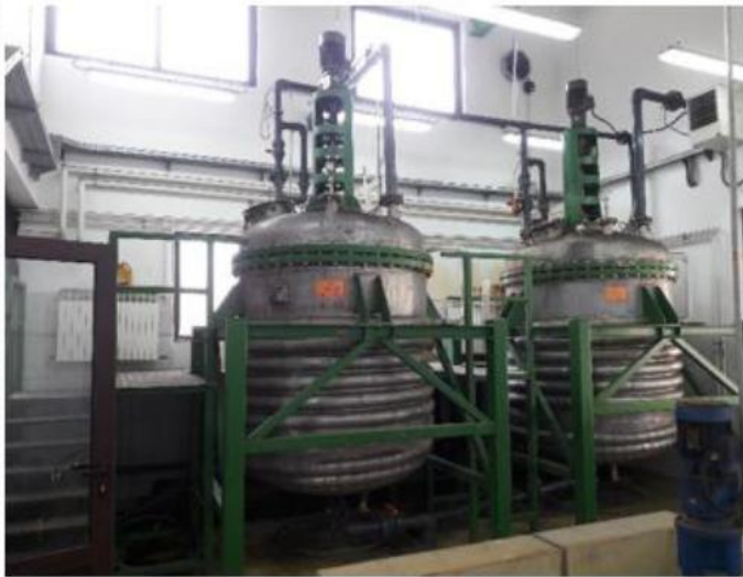
Reaktori za redukcija toka I