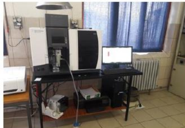
Atomski apsorpcioni spektrometar sa hidridnom tehnikom