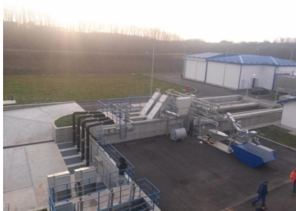
Slika 2. Mehanički tretman

Sa fine rešetke otpadna voda dalje teče prema pjeskolovu/mastolovu. U komorama pjeskolova pijesak i šljunak se sliježu na dnu rezervoara zbog male brzine proticanja. Komora pjeskolova je aerisana kako bi se organske materije održale suspendovanim i kako bi se masnoća uklonila i prebacila u mastolov. U mastolovu se uklanjaju masti i ulja pokretnom strugalicom i otpremaju u rezervoar za masti. Poslije ovakvog primarnog tretmana predobrađena otpadna voda dalje teče u egalizacioni bazen. Bazen je projektovan tako da izjednači hidraulične fluktuacije i oscilacije koncentracije dolazećih otpadnih voda. Sadržaj egalizacionog bazena se kontinuirano miješa potopljenim mikserima kako bi se izbjeglo taloženje čestica. Iz egalizacionog bazena otpadne vode se otpremaju u SBR bazene po određenom vremenskom programu.