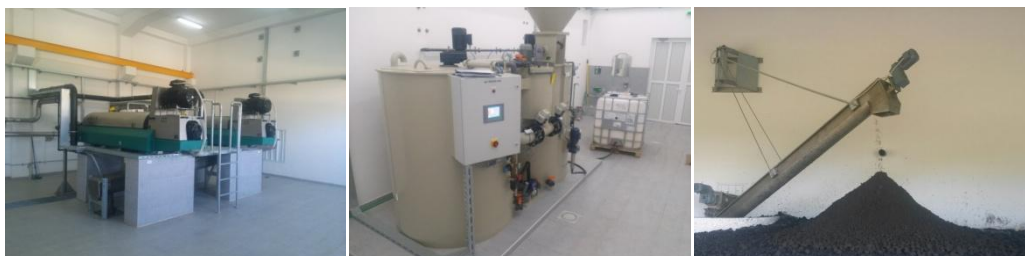
Slika 4. Centrifuge Slika 5. Polimerna stanica Slika 6. Dehidrirani mulj

Biološkim prečišćavanjem otpadne vode u SBR bazenima nastaje višak aktivnog mulja koji mora biti uklonjen iz procesa. Aerobno stabilizovani mulj se izvlači na početku dekantacije i prepumpava u spremnik viška mulja. U spremniku se mulj mikserom homogenizuje i na taj način obezbjeđuju se konstantni uslovi za dehidraciju i takav se otprema u sistem za dehidraciju mulja, tj. na centrifugiranje (Slika 4.). Aerobno stabilizovani mulj će biti mehanički isušen odnosno dehidriran dodatkom polielektrolita spremljenog u stanici za pripremu polimera (Slika 5.). Stanica za pripremu polimera raspolaže sopstvenim samostalnim sistemom kontrole. Jedinica paralelno radi sa sistemom dehidracije. Polimer u prahu ili tečni polimer može biti pripremljen kao rastvor sa koncentracijom u rasponu od 0,1% do 0,5%. Rastvor se dozira pumpama za doziranje u odgovarajuće centrifuge. Isušeni mulj se prenosi preko transportera u zonu za privremeno skladištene dehidriranog mulja (Slika 6.) i ima procenat suve materije oko 22%.