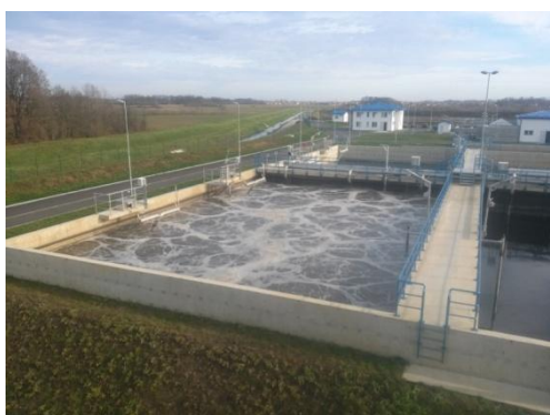
Slika 3. Prikaz SBR-a u fazi aeracije

Danas se koriste različite tehnologije obrade otpadne vode aktivnim muljem. Jedna od tih tehnologija je i SBR (Sequencing batch reactor) tehnologija koja se primjenjuje na PPOV. SBR tehnologija radi na principu diskontinualnog postupka biološke obrade gdje se u jednom reaktoru naizmjenično odvijaju različite faze cijelog procesa obrade, kao što su punjenje, reakcija, sedimentacija i dekantacija prečišćene vode (Slika 3.). Radom SBR bazena se u potpunosti upravlja automatskim kontrolnim sistemom, koji preusmjerava protok u bazene i kontrolišu faze u svakom bazenu. Princip rada je „konstantno vrijeme ciklusa“.