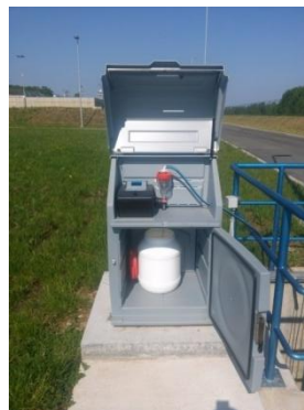
Slika 7. Ulazni automatski uzorkivač Slika 8. Izlazni automatski uzorkivač

U sljedećoj tabeli (Tabela1.) dati su parametri kvaliteta ulazne otpadne vode, prečišćene otpadne vode, ostvarena efikasnost prečišćavanja i efikasnost prečišćavanja po projektu. Prikazane vrijednosti koncentracija predstavljaju srednju mjerenu vrijednost u periodu januar-mart 2016 godine.