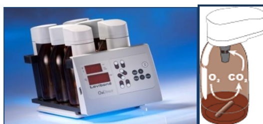
Slika 4. Aparatura za određivanje \text{BPK}_5 , BOD OXIDIRECT, LOVIBOND [6]

BPK je količina kisika koja je potrebna mikroorganizmima uzorka vode da u aerobnim uslovima na temperaturi od 20 \text{ }^\circ\text{C} , u određenom vremenu inkubacije, oksiduju organske materije u vodi [4]. Za određivanje \text{BPK}_5 korištena je manometarska metoda i uređaj BOD SISTEM Oxidirect, Lovibond, koji je prikazan na slici 4.