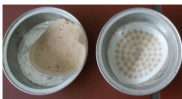
Slika 5. Postupak određivanja SM – standardna metoda „Natron-Hayat“ d.o.o. Maglaj [1]

Prema uredbi o uslovima ispuštanja otpadnih voda u okoliš i sisteme javne kanalizacije granična vrijednost ukupnih suspendovanih materija tehnoloških otpadnih voda koje se ispuštaju u površinska vodna tijela iznosi 35 \text{ mg}/\text{dm}^3 .