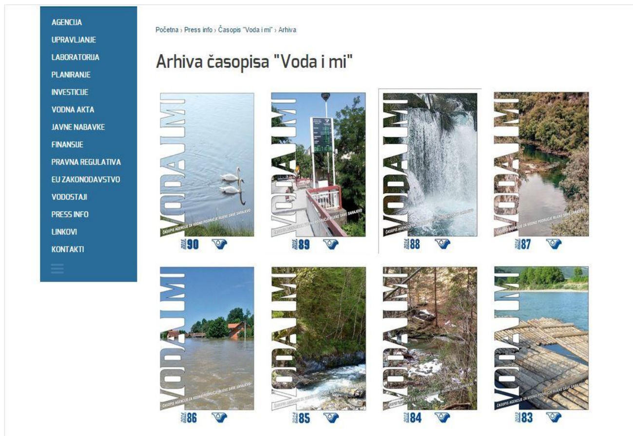
Slika 3

Sa početkom izrade Plana upravljanja vodama, Agencija je posvetila poseban dio portala i izradi nacrtu Plana kako bi šira javnost, pored generalnih informacija i uvida u raspoloživu dokumentaciju, mogla dostaviti i svoje komentare na isti (vidi narednu sliku).