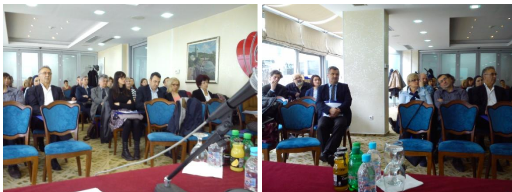
Slika 7 Presentacija nacrtu Plana upravljanja vodama u Sarajevu