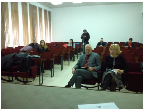
Slika 6 Presentacija nacrtu Plana upravljanja vodama u Travniku