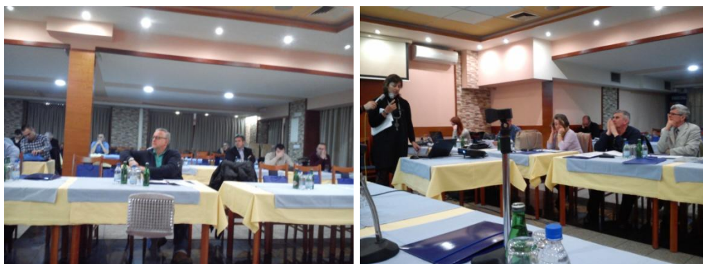
Slika 5 Prezentacija nacrt Plana upravljanja vodama u Odžaku

Prezentacije nacrt Plana upravljanja održane su u Odžaku (15.03.2016), Travniku (23.03.2016.) i Sarajevu (29.03.2016.) i na njima su prisustvovali predstavnici institucija koje se bave vodama na općinskom, kantonalnom, federalnom te državnom nivou, predstavnici korisnika i zagađivača voda, predstavnici naučnih i stručnih institucija u FBiH, nevladin sektor, mediji i dr.